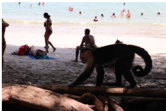
Affe am Strand vom Manuel Antonio Nationalpark