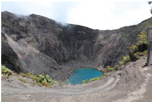
Irazu Vulkan, Tagesausflug von San José aus

Es fällt mir wirklich schwer mich bei meinen Erzählungen kurzzufassen, daher hier einfach die Bilder meiner Reise-Highlights aus Costa Rica: