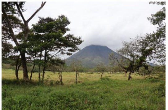
Der Arenal Vulkan und die Gegend um La Fortuna

Außerdem gibt es noch vieles mehr zu sehen, auch vieles als Tagesausflug von San José aus. Zudem hatte ich die Möglichkeit nach meinem Semester noch nach Panama und Nicaragua zu reisen und kann sagen, dass insbesondere Granada, León und die Isla de Ometepe in Nicaragua und die Gegend von Bocas del Toro und Panama Stadt absolut sehenswert sind.