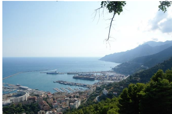
Blick auf den Porto von Salerno vom Castello d'Arechi aus