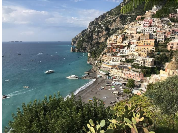
Positano - Amalfiküste

klare und türkise Wasser hüpfen kann. Neben den kleinen Buchten sollte man sich auf keinen Fall die Wanderwege der Amalfiküste entgehen lassen! An den weiten Sandstränden südlich von Salerno kann man auch hervorragend ein Buch lesen und schwimmen. Geschichts- und Kulturfreaks können ihr Herz bei einem Besuch des Vesuvs, von Pompei, von Ercolano, von Caserta und von Paestum zum Hüpfen bringen.