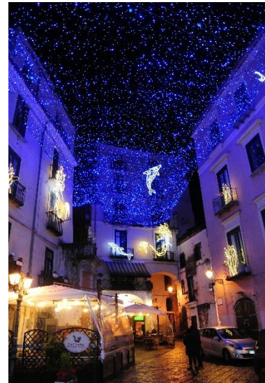
herrlich kitschige Winterbeleuchtung

Salerno ist eine gemütliche und herzliche Stadt inmitten einer malerischen Landschaft! Ich habe mich in diese Region verliebt und könnte stundenlang davon erzählen. Das aufregendste Partyleben für Studierende mag Salerno vielleicht nicht bieten (außer bei ESN Parties oder in Neapel), dafür wird Dolce Vita großgeschrieben. Tagsüber geht man auch im Winter bei schönstem Sonnenwetter am kilometerlangen Lungomare spazieren, isst Eis unter Palmen, trinkt Espresso mit seinen Freunden, schlendert über die Einkaufsstraße, genießt köstliches italienisches Essen (Salerno liegt inmitten der Pizza-/Mozzarella-/immer frisches regionales Gemüse/Zitronen-Region!), schaut den Sonnenuntergang vom Stadtstrand und lässt den Abend bei einem Glas Vino in einer der kleinen Bars in der Altstadt ausklingen. Salerno hat alles was einen glücklich macht und sollte einem doch einmal das aufregende Großstadtfieber packen ist man ganz schnell in Neapel. Zur Gemeinde Salerno gehört im Norden die traumhafte Amalfiküste, die man problemlos mit Bussen und Booten erkunden kann und wo man in das