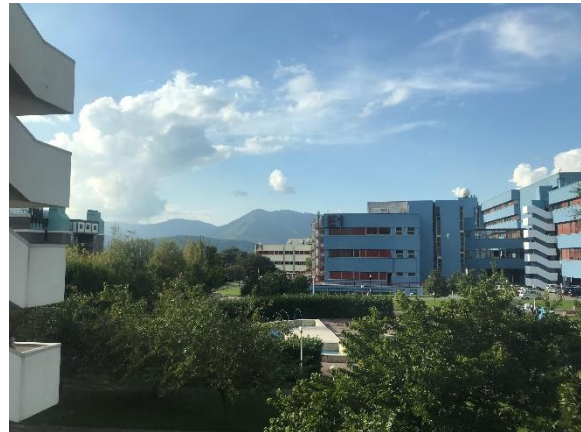
Università degli studi di Salerno inmitten grüner Berge

Ab und an war es etwas nervig extra mit dem Bus nach Fisciano zu fahren, jedoch war es halb so wild, da das mir prophezeite süditalienische Verkehrschaos ausblieb und die Busse kamen. Nicht immer pünktlich, aber irgendeiner der drei möglichen Busse kam immer nach ein paar Minuten. Ich habe in Süditalien definitiv gelernt mich nicht über jede Kleinigkeit aufzuregen und zu entschleunigen. (Der Bus ist fünf Minuten zu spät? – Super! Fünf Minuten länger in der Sonne an der frischen Luft!)